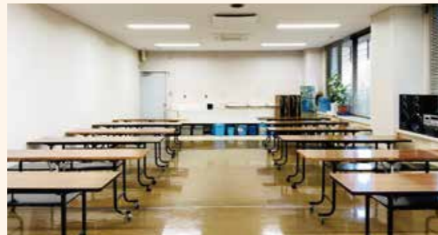
講習室 水道完備で、絵画など作品づくりのアトリエとして利用できます。