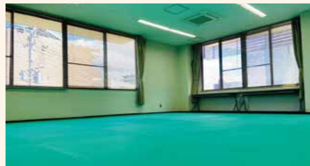
第2会議室 第2会議室にはマットを敷き、ヨガなど軽い運動ができる会場にもなります。