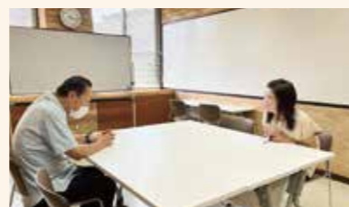
勤労者のためのこころの健康相談 産業衛生学会専門医による個別カウンセリングを行います。先着順電話受付中です。

実施日時 木曜又は土曜 9：00～17：00（1人1時間以内） 対象 16歳以上の勤労者/定員になり次第受付終了