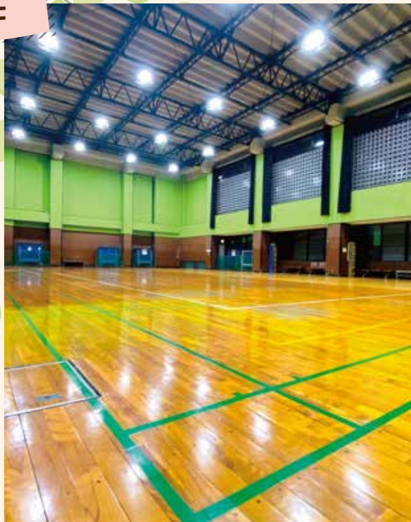
体育室 バドミントンコート3面分の広さがあり、卓球やミニバレーボールもできます。更衣室あり。