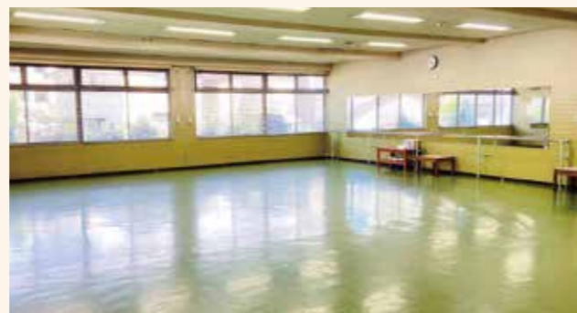
ホール 正面に大きな鏡があるのでダンスなどの練習に最適です。