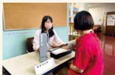
健康相談 看護師による血圧測定や健康相談を行います。

開設時間 9：00～12：00、13：00～16：00 日程はホームページをご覧ください。