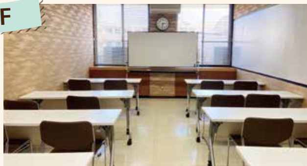
第3会議室 少人数での会議や研修にご利用ください。