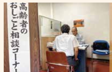
高齢者のおしごと相談コーナー 健康で就業意欲の高いシニアの皆様に向けたおしごと相談を行います。

開設時間 9：00～12：00、13：00～16：00 日程はホームページをご覧ください。