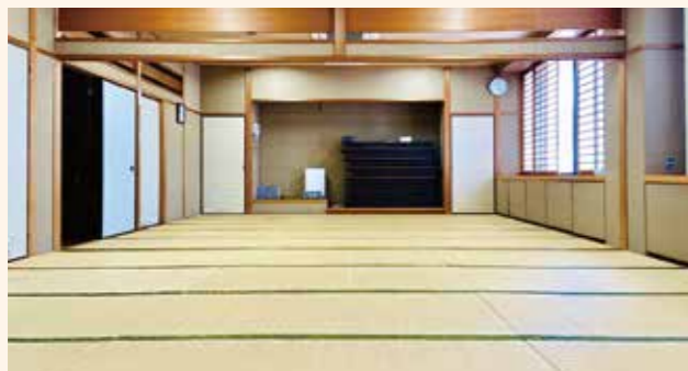
和室 和室は中央を襖で仕切ること、第1・第2和室となります。座卓15台。