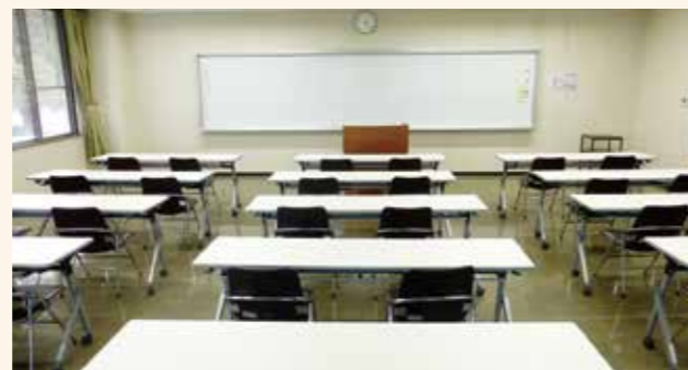
大会議室 会議や研修にご利用ください。 ※大会議室の中央をパーテーションで仕切ること で、第1・第2会議室となります。