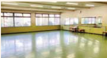
ホール 正面に大きな鏡があるのでダンスなどの練習に最適です。